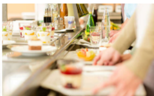
Restauration collective A l'école, au travail, en établissement de santé...