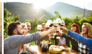
Restauration festive Cercle familial, amical ou professionnel, goûter d'anniversaire, apéritif, cocktail...

IMPORTANT - PREVENIR systématiquement l'entourage de la personne allergique : enseignants, personnels encadrants, amis, famille, collègues, ... Dès qu'il y a une nouvelle personne dans l'entourage, s'assurer qu'elle est avertie de l'allergie (enseignant remplaçant, nouvel animateur, nouveau professeur...)